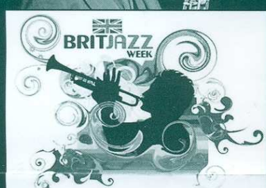
Lee Konitz New Quartet