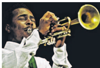
Meister geschliffener Töne: Roy Hargrove.